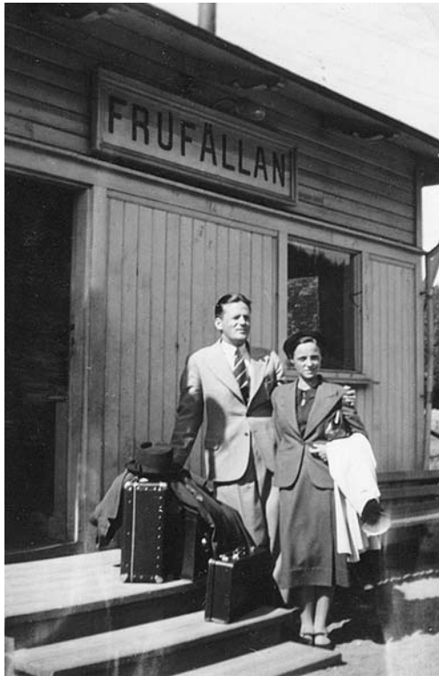
Frufällans första väntpaviljong från 1912. Den flyttades 1938 till Skalle och därifrån till Anten-Gräfsnäs järnvägsmuseum 1987.