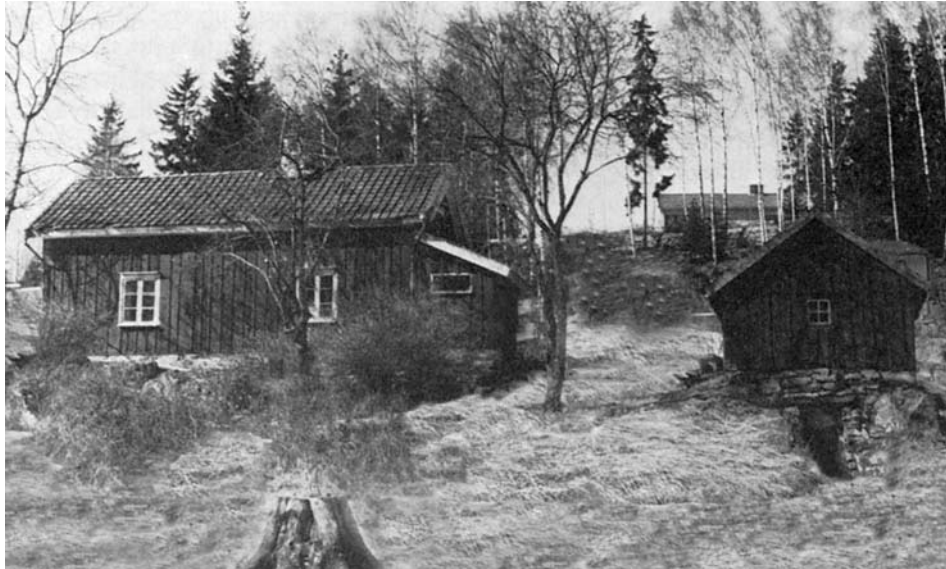
Torpet Frufällan. Senare ett litet hemman, 1/32 mtl, med fastighetsbeteckningen Längjum Frugården 4:6.