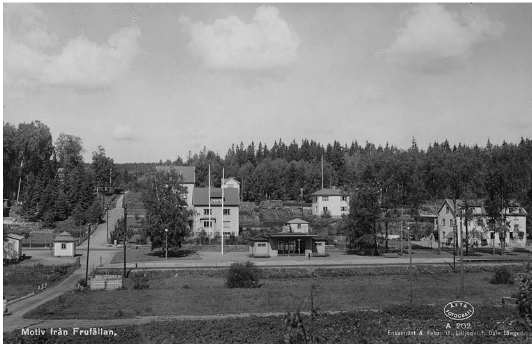
Frufällans centrala delar. I mitten stationsbyggnaden i funkisstil från 1938. Den tillbyggdes 1949 med godsmagasin norrut (åt höger) och 1954 med postexpedition söderut. Allt revs 1992.

Den första väntpaviljongen låg 100 m till höger, nära järnvägs korsningen.