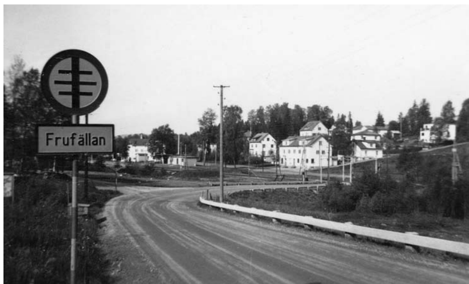
Frufällan klassades som tätbebyggt samhälle 1947, vilket vägskylten bekräftar.

Senare blev Frufällan också ett ortnamn för postadresser och dess utbredningsområde sätter idag gränserna för samhället. Någon strikt avgränsning finns inte. Skulle postadressen