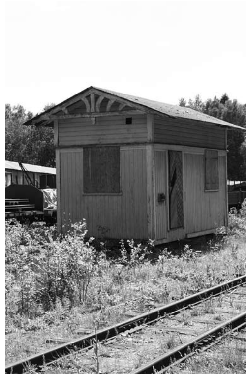
Idag står hållplatsbyggnaden 2 km norr om Antens station. Den är i ganska dåligt skick.